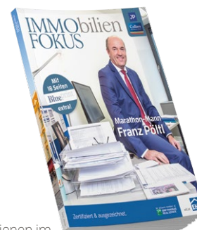
Erschienen im ImmoFokus Winter 2019

Panello und myfavoriteplace mit GBB Award ausgezeichnet. Im Rahmen des 10-jährigen Jubiläums der „Green & Blue Building“ (GBB) wurden heuer in der wolke19 im Ares Tower (Wien) zum achten Mal ökologisch, sozial und wirtschaftlich nachhaltige Immobilienprojekte, Dienstleistungen und Produkte ausgezeichnet. Die Sieger 2019 sind die raumklimaverbessernden Panello Raumklimaplatten von Emoton und das nachhaltige Immo-Projekt „myfavoriteplace“ vom Bauträger green urban living.